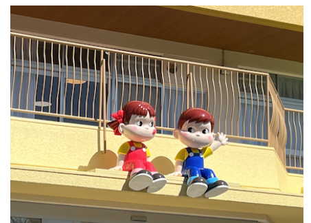
▲園児を見守るペコちゃん・ポコちゃん

秦野市立ほりかわ幼稚園を「就学前の子どもに関する教育、保育等の総合的な提供の推進に関する法律」に規定する公私連携幼保連携型認定こども園(ペコちゃんこども園ほりかわ)として、令和7年4月1日から移行することに伴い、秦野市立ほりかわ幼稚園を廃止する議案が出され賛成多数で可決しました。