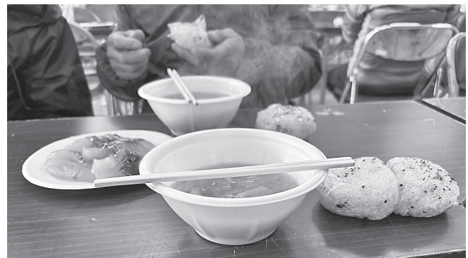
私設エイド（西原集会所）にて