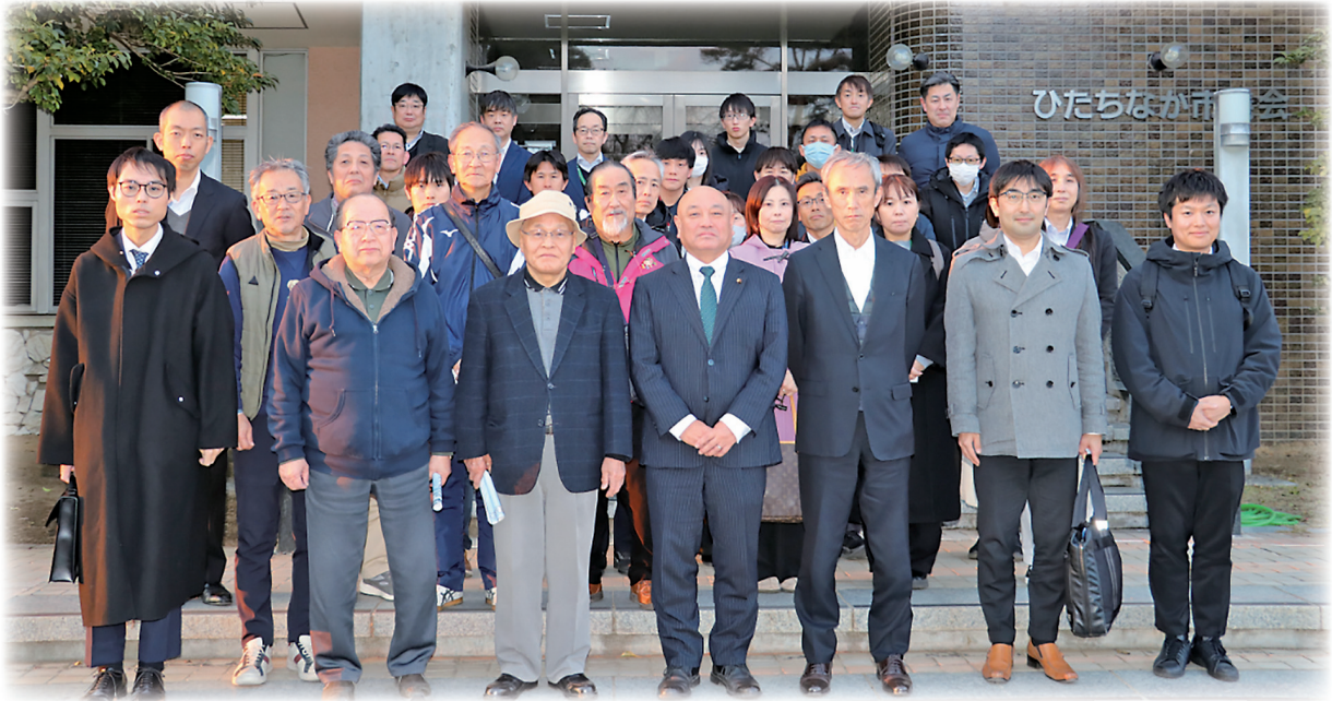
▲傍聴いただいた皆さまと一緒に

お忙しいところ、長時間にわたり会場にて傍聴いただいた皆さま、また 生中継配信にてご視聴いただいた皆さま、ありがとうございました。