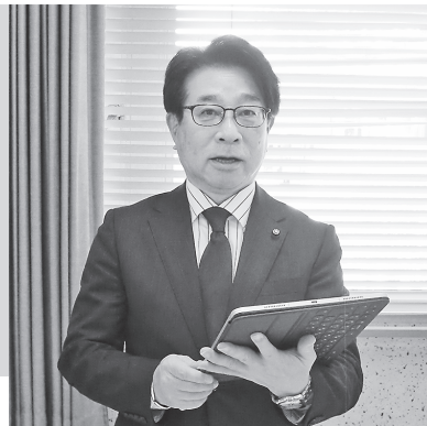
文教福祉委員会で質問

今回は、令和8年度予算の概要と主な事業内容、令和7年度補正予算の内容、トピックスについて報告します。