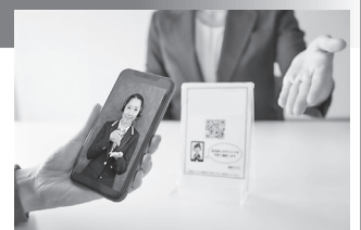
「遠隔手話通訳システム」で手話によるコミュニケーション

ひたちなか市では、聴覚に障がいがある方が、買い物や病院に行って意思を伝えたり、市役所の窓口を訪れて手続きをする際に、スマートフォン等のテレビ電話機能を通じて、手話通訳センターに常駐する手話通訳者が画面越しに手話通訳を行い、意思疎通ができるようにする「遠隔手話通訳システム」を令和7年8月から導入しました。提供するサービスは3種類あり、一つ目は、聴覚障がい者の市民向けで、利用登録すれば、どこにいても手話通訳者を介して会話支援をもらえる「えんか+」。二つ目は、各課に相談や手続きに訪れた際、障害福祉課の窓口を設置したQRコードをスマホ等で読み取ることで、手話通訳者により市職員との意思疎通を仲介してもらう。三つ目は、自宅に居ながら市へ問い合わせる時に市のホームページからアクセスし、手話通訳者を介し、担当課に電話をかけて話してもらう「電話代理支援」です。このうち、二つ目と三つ目の市の窓口対応サービスは事前登録が不要で、市民以外の方も利用できます。今後も、障がい者の方が行政サービスを利用しやすい環境づくりと支援策向上に取り組んでいきます。