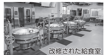
改修された給食室

市毛小学校給食室改修事業において、国庫補助である学校施設環境改善交付金の事業採択が前倒しされたことに伴う補正増額。