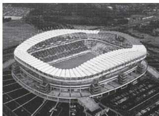
カシマサッカースタジアム