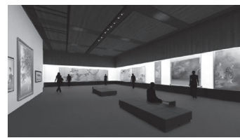
リニューアル後の常設展示室 (イメージ)